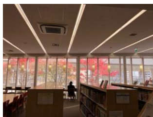
まるで、絵のような美しさ…でしょ？もうしばらく楽しめそうです。

大きいせいか、晴天続きの光彩のおかげか、昨年にも増して美しいような気がします。今の時期だけのお楽しみ。本を読みつつ、紅葉を愛でながらのんびり過ごすのもいいものです。