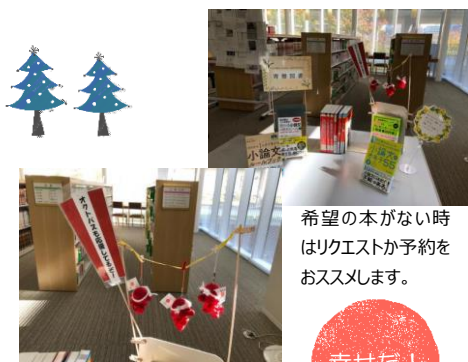
希望の本がない時はリクエストか予約をおすすめします。